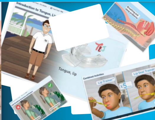
Myobrace® Activities Fast Track